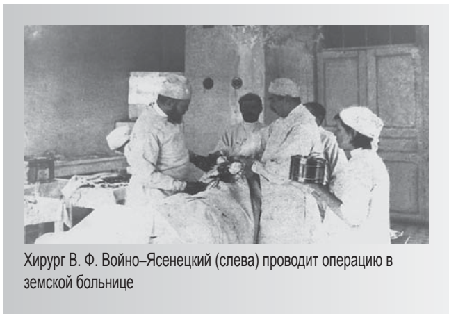
Хирург В. Ф. Войно-Ясенецкий (слева) проводит операцию в земской больнице

к его фамилии, происходящей из знатного, но небогатого польского рода, полагалась приставка «Войно», что значит «воин». Валентин записался добровольцем на Русско-японскую войну и в марте 1904 года отправился на восток, в Сибирь, врачом Киевского госпиталя Красного Креста. В госпитале в Чите его пациентами вскоре стали те же крестьяне, только в военной форме.