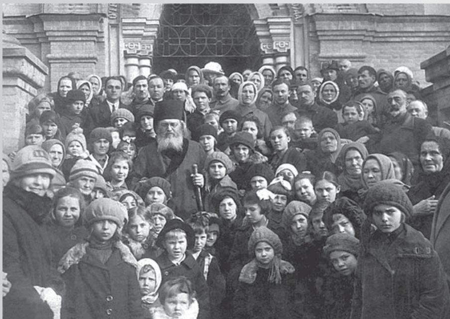
Архиепископ Лука в окружении паствы.

С успехом он работал в таких областях хирургии, как нейрохирургия и ортопедия. Это был ученый, готовый к крупным и объективным исследованиям и анализу.